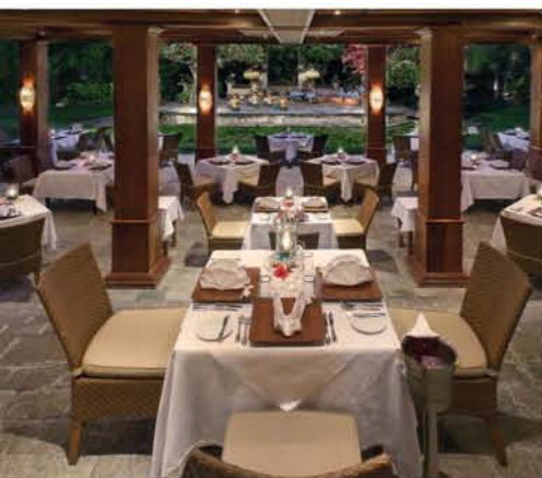
Vor dem luftigen Pavillon des Gourmetrestaurants Dewi Romana blühen filigrane Seerosen.

B ali hat sich fein gemacht. Nicht für uns, sondern für das Galungan-Fest, einer der heiligsten Feiertage des Agama Hindu Dharma, der weltweit einzigartigen Religion der Balinesen. Zehn Tage dauern die Festlichkeiten, mit denen der Sieg des Guten über das Böse und die Schöpfung des Universums gefeiert wird. Aus diesem Anlass scheinen die Ortschaften in eine Art Wettstreit à la „Unser Dorf soll schöner werden“ getreten zu sein. Unendlich viele Penjors, Weihgeschenke aus meterhohen Bambusstäben, säumen die Straßen, kunstvoll verziert mit Seidentüchern, Spiegeln, Blumen oder Bambusgeflecht. Ja, selbst jedes Auto, natürlich auch die klimatisierte Hotellimousine, die uns vom internationalen Flughafen in den unberührten Nordwesten der Insel bringt, ist geschmückt. Die scheinbar unzähligen Tempel (jedes balinesische Dorf hat min-