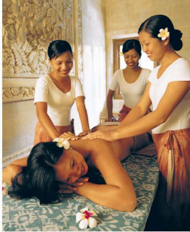
Ultimativer „Matahari-Entspannungskick“: die Sechshand-Synchronmassage.