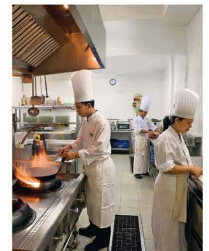
Wie es der Philosophie von Relais & Châteaux entspricht, kommt der Kulinariik eine besondere Bedeutung zu.