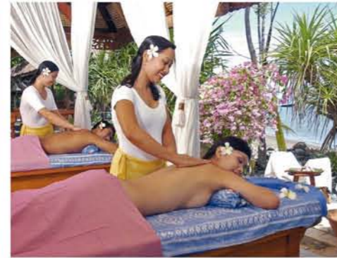
Ein Ausflug in die Unterwasserwelt, eine Massage oder ein Dinner am Strand – nur ein Ausschnitt der Urlaubsvergnügen.